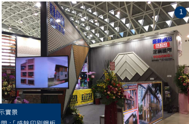
圖 1：2015 年盛餘集團展示實景

盛餘去年參加高雄國際建材大展，已在南台灣建立良好的公司形象，故這次第2屆再參展，以持續建立盛餘鋼品形象，讓參訪者留下優良品牌的深刻印象，身為高雄在地的廠商是一定要支持高雄所舉辦之參展活動。此次也有同業及下游成