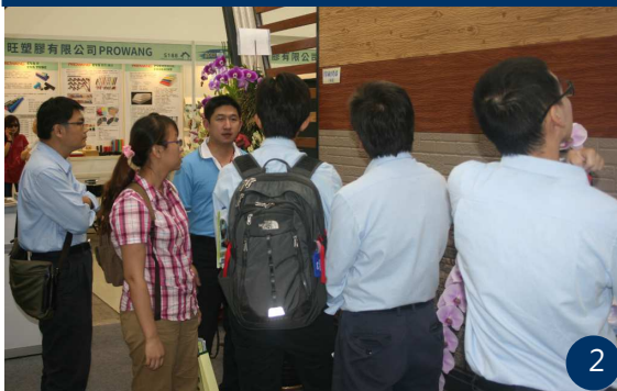
圖 3：讓一般民眾充份瞭解盛餘是一家一貫化鋼鐵專業製造廠。