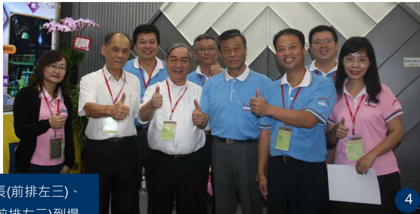
圖 4、圖 5：大森董事長(前排左三)、程總經理(前排左二)到場支持盛餘團隊。

視播放著盛餘最新簡介及多樣工程施工，以及完工圖照，吸引民眾注目。雖是第 2 年承