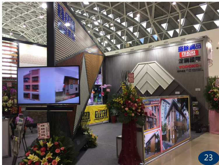
圖 23：會場外觀。工程實績展視，營造出整體氣氛，讓盛餘鋼品充滿亮點。