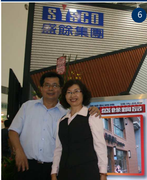
圖 7：中鋼構陳董事長(左二)蒞臨指導，與大夥談笑風生。