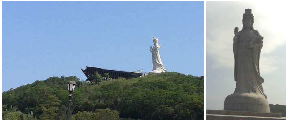
▲ 媽祖神像乘風破浪，祈求國泰民安。

馬祖概分六大島：南竿、北竿、東莒、西莒、東引、西引。南竿是媽祖成仙的寶地，故稱馬祖，有天后宮、巨石神