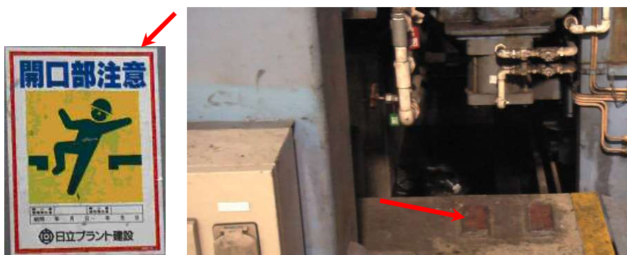
▲ 在這樣的地方上方貼著