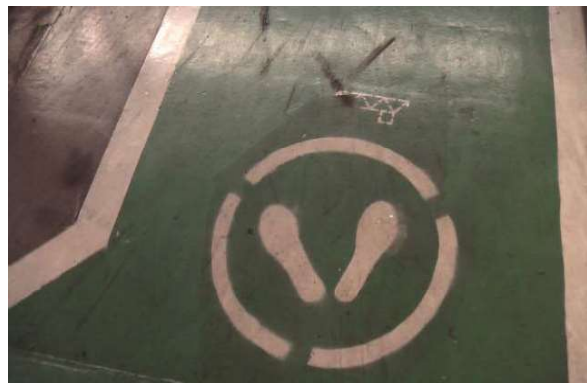
▲例二：前有天車經過須注意