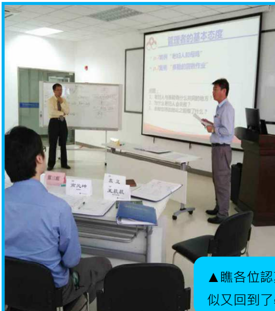
▲瞧各位認真的樣子，好似又回到了學校課堂。

2015 年 9 月 18 日上午 9:00，這個看似非常平淡無常的日子，淀川盛餘(合肥)高科技鋼板有限公司(簡稱 YSS) 303 會議室內卻充滿了歡聲笑語，23 名 YSS 科長級人員彷彿又回到了校園時代，學員們你一言我一語，爭先恐後搶著回答老師提出的問題，甚至一些觀點與見解讓老師連呼「想不到.....」。