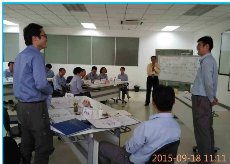
▲觀念 PK 環節，兩位小夥伴「唇槍舌劍」，你來我擋好不熱鬧。